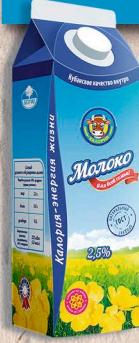
МОЛОКО ГОСТ, 2,5% 950г. 10 сут.