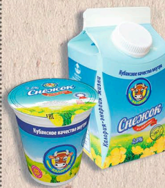
СНЕЖОК 2,5%, 200г., 450г., 14 сут.