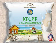
КЕФИР ОБОГАЩЕННЫЙ БИФИДОБАКТЕРИЯМИ 2,5%. 500г-7 сут.