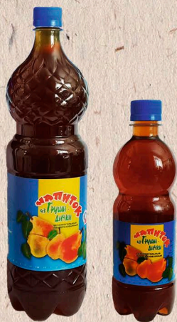
НАПИТОК БЕЗАЛКОГОЛЬНЫЙ ИЗ ГРУШИ ДИЧКИ Бутылка, 1,5л., 0,5л. 90 сут.