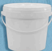
КРЕМ НА РАСТИТЕЛЬНЫХ МАСЛАХ 20%, 5кг., 45 сут.

Молокосодержащий продукт произведенный по технологии СЫРА плавяного 60% 5 кг., 60 сут.