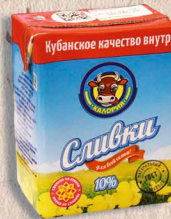
СЛИВКИ ультрапастеризованные, 10 % 200мл. 6 мес.