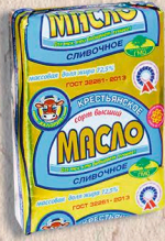
МАСЛО КРЕСТЬЯНСКОЕ (высший сорт) ГОСТ, 72,5% 170г.