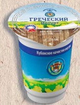
ГРЕЧЕСКИЙ ЙОГУРТ 2,5%, 400г., 21 сут.