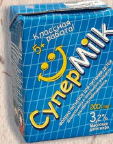
МОЛОКО для питания детей дошкольного и школьного возраста ультрапастеризованное, 3,2 %, 200мл. 6 мес.