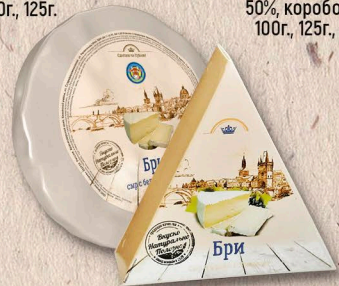
БРИ 50%, коробочка, фольга 90г., 110г., кг.