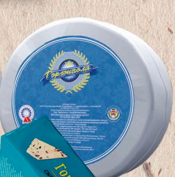
ГОРГОНЗОЛА 55% фольга 1кг. 60 сут.[0-4]°С, 100г. 30 сут.[0-6]°С