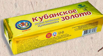
МАСЛО «КУБАНСКОЕ ЗОЛОТО» (высший сорт) ГОСТ, 72,5%. 450г.