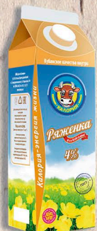
РЯЖЕНКА ГОСТ, 4%. 1000г. 10сут.