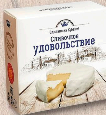
СЛИВОЧНОЕ УДОВОЛЬСТВИЕ 60%, коробочка 100г., 125г.