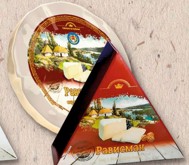
Рависман 45%, коробочка, фольга 150г., кг.