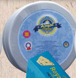
ROYAL CHEESE КОРОЛЕВСКИЙ СЫР 60% фольга 1кг. 60 сут.[0-4]°С, 100г. 30 сут.[0-6]°С