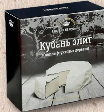
КУБАНЬ-ЭЛИТ в пепле фруктовых деревьев 50%, коробочка 100г., 125г.