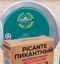
ПИСАНТЕ ПИКАНТНЫЙ 50% фольга, коробочка 1кг. 60 сут.[0-4]°С, 100г. 30 сут.[0-6]°С