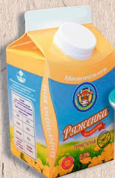
РЯЖЕНКА ГОСТ, 2,5% 200г., 450г. 10 сут.