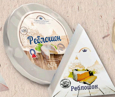
Реблешон 50%, коробочка, фольга 90г., 110г., 650г., кг.