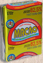
МАСЛО ТРАДИЦИОННОЕ (высший сорт) ГОСТ, 82,5% 170г.