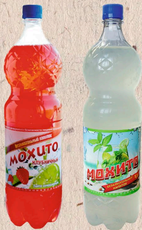
НАПИТОК БЕЗАЛКОГОЛЬНЫЙ МОХИТО, МОХИТО КЛУБНИЧНЫЙ 1,5л., 180 сут.