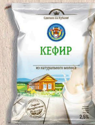
КЕФИР ГОСТ, 2,5% 1000г-10 сут.