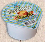
ГОРЧИЦА 8%. 100г. 45 сут.