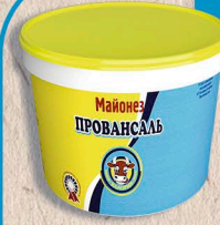
МАЙОНЕЗ ПРОВАНСАЛЬ 67%. 900г., 5кг. 30 сут.