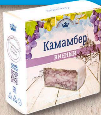
КАМАМБЕР ВИННЫЙ 50%, коробочка, 100г., 125г., кг.