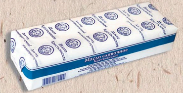
МАСЛО В ПЕРГАМЕНТЕ (высший сорт) ГОСТ, 72,5%. 450г.