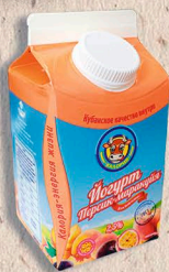
ЙОГУРТ «ПИТЬЕВОЙ» С АРОМАТОМ ПЕРСИКА-МАРАКУЙИ 2,5%, 450 г. 14 сут.