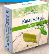
КАМАМБЕР ПЕСТО 50%, коробочка, 100г., 125г., кг.