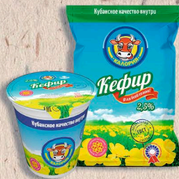
КЕФИР ГОСТ, 2,5% 180г., 200г., 900г. 10 сут.