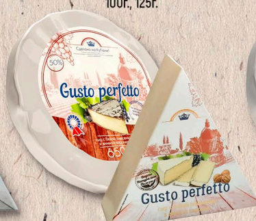
Gusto perfetto Совершенный вкус в винной корочке 50%, коробочка, фольга 90г., 110г., 650г., кг.