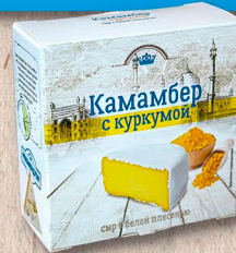
КАМАМБЕР С КУРКУМОЙ 50%, коробочка, 100г., 125г., кг.