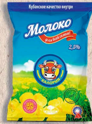
МОЛОКО ГОСТ, 2,5% 900г. 7 сут.