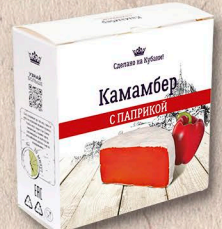
КАМАМБЕР с паприкой 50%, коробочка 100г., 125г., кг.