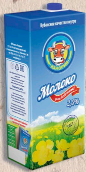
МОЛОКО 2,5% ультрапастеризованное ГОСТ, 2,5%. 1000мл. 6 мес.