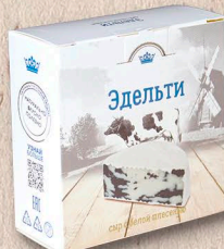
ЭДЕЛЬТИ 50%, коробочка, 100г., 125г., кг.