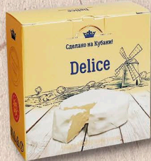
DELICE ВОСТОРГ 50%, коробочка 100г., 125г.