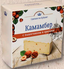
КАМАМБЕР с пажитником и орехами 50%, коробочка 100г., 125г., кг.