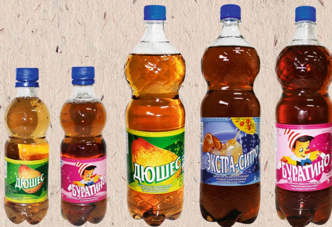
НАПИТОК БЕЗАЛКОГОЛЬНЫЙ среднегазированный на ароматизаторах с сахарозаменителем: ДЮШЕС, ЭКСТРА-СИТРО, БУРАТИНО Бутылка, 1,5л., 0,5л. 180 сут.