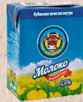
МОЛОКО 2,5% ультрапастеризованное ГОСТ, 2,5%. 200мл. 6 мес.