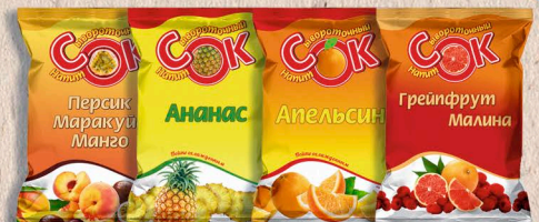
НАПИТОК СЫВОРОТОЧНЫЙ, с соком Апельсина, Ананаса, Грейпфрута и малины, Персик Маракуйя Манго 900 мл. 14 сут.