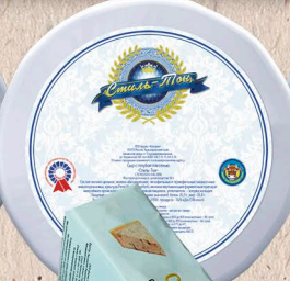
СТИЛЬ-ТОН 50% фольга 1кг. 60 сут.[0-4]°С, 100г. 30 сут.[0-6]°С