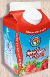
ЙОГУРТ «ПИТЬЕВОЙ» С АРОМАТОМ КЛУБНИКИ 2,5% - 5кг., 450г., 200г., 100г. 2,7% - 180г., 3,2% - 5кг., 180г.