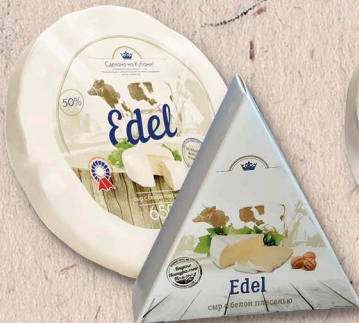
Edel Благородный 50%, фольга, коробочка 90г., 110г., 650г., кг.