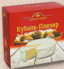
КУБАНЬ-ПЛЕЗИР 50%, коробочка 125г., кг.