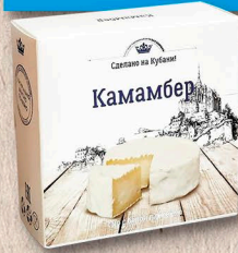
КАМАМБЕР 50%, коробочка 125г.

Срок годности: Головы [0-4]°С 60 сут./Сегменты [0-6]°С 45 сут.