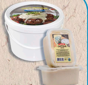
СЫРНЫЙ СОУС «БЛЮ-ЧИЗ» 50%, 250г., 1,5кг 60 сут.,