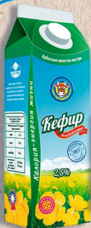
КЕФИР ГОСТ, 2,5%. 900г., 450г. 10 сут.