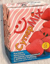
ультрапастеризованные 2,5%, 6 мес.