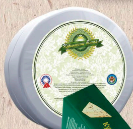
КУБАНСКИЙ БЛЮЗ 50% фольга 1кг. 60 сут.[0-4]°С, 100г. 30 сут.[0-6]°С