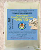
ЮЖНЫЙ ПЛАВЛЕННЫЙ «БЛЮ-ЧИЗ» С ГОЛУБОЙ ПЛЕСЕНЬЮ 50%. кг. 75 сут.