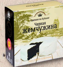
ЧЕРНАЯ ЖЕМЧУЖИНА 50%, коробочка 100г., 125г.