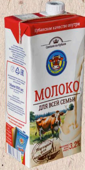
МОЛОКО 3,2% ультрапастеризованное ГОСТ, 3,2%. 1000мл. 6 мес.