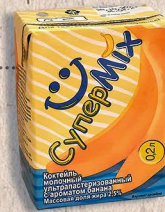
шоколадный, со вкусом банана, клубники и ванили 200мл.