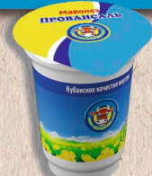
МАЙОНЕЗ ПРОВАНСАЛЬ 67%. 400г., 230г. 30 сут.